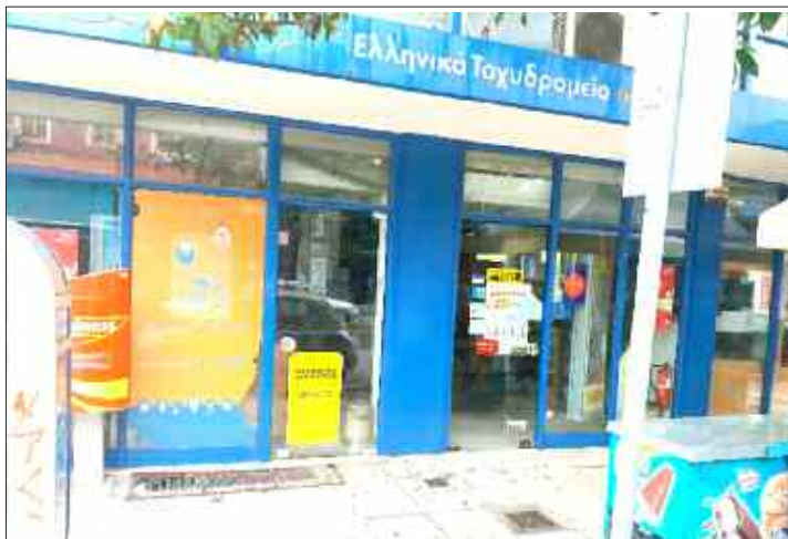
Κλειστά ήταν τα καταστήματα των ΕΛΤΑ χθες, λόγω της 24ωρης απεργίας των εργαζομένων σ' αυτά

Κ λειστά ήταν χθες όλα τα καταστήματα των ΕΛΤΑ στον ν. Τρικάλων, λόγω της 24ωρης απεργίας που προκήρυξε το συνδικαλιστικό όργανο του κλά-