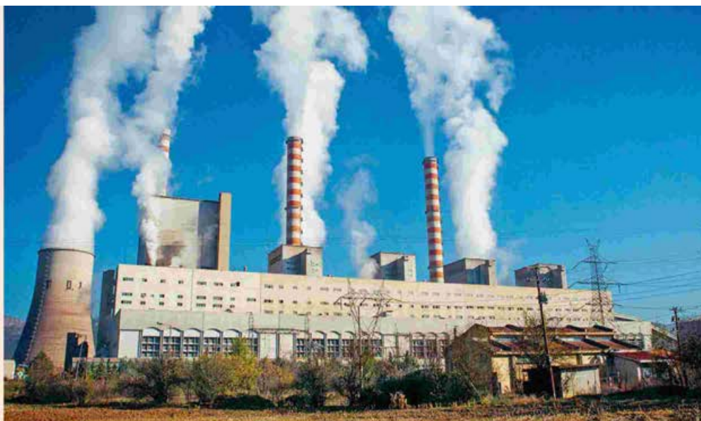
Το σχέδιο της αποεπένδυσης στον λιγνίτη καταλήγει σε αδιέξοδο, με την κυβέρνηση να αγοράζει χρόνο μέσα από συνεχείς παρατάσεις για να διαχειριστεί επικοινωνιακά το φιάσκο και τη διοίκηση της ΔΕΗ να εξετάζει εναλλακτικά σενάρια για να μεταθέσει για αργότερα τις δυσμενείς επιπτώσεις.